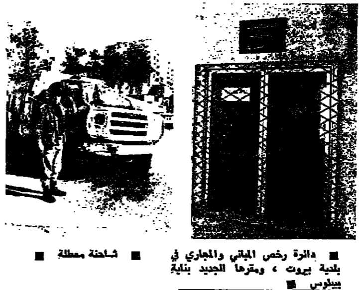
دائرة رخص المباني والجاري في بلدية بيروت ، ومقرها الجديد بناية بيبسوس